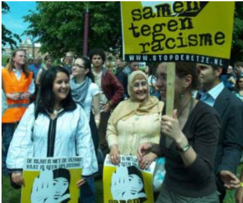
Veel diversiteit onder de demonstranten op het Museumplein tijdens de Top.

die 'blanke' man kunnen wegnemen, dan ontnemen wij een groot deel van het arsenaal aan valse argumenten.