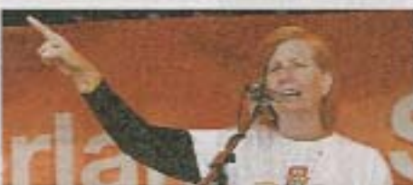
Peacemom Cindy Sheehan spreekt op het Amerikaanse consulaat in Amsterdam.

CINDY SHEEHAN , moeder van een in Irak gesneuvelde soldaat, is Amerikaanse spreker in Amsterdam tegen de G8-top. „De G8-top wordt gehouden in Dublin. 5 miljoen in één van landen betogen op een voorjaar met lange maar een protestboodschap schreef.“