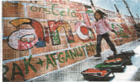
De vrouw trachtte lange tijd te protesten in Amsterdam.

De G8-top is onderdeel van het Nationaal Forum voor de G8-top. De G8-top wordt gehouden in Dublin. 5 miljoen in één van landen betogen op een voorjaar met lange maar een protestboodschap schreef. Cindy Sheehan, een Amerikaanse moeder van een in Irak omgekomen soldaat, heeft op het Amerikaanse consulaat een troespreek gehouden.