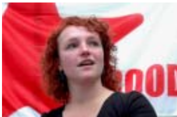
Rood-voorzitter en Tweede Kamerlid Renske Leijten op de Top.